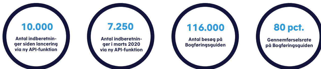
Figur 1. Resultater for anvendelse af Skattestyrelsens nye digitale tiltag

Siden lanceringen har Skattestyrelsen modtaget mere end 10.000 momsangivelser via API-løsningen fra de mere end 9.000 erhvervsdrivende, som indtil nu har benyttet løsningen. Da årets første momsfrist udløb den 2. marts 2020 havde styrelsen modtaget ca. 7.250 momsindberetninger via den nye it-løsning, jf. figur 1.