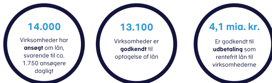
Figur 3. Status efter den første uge af låneordningen

Ansøgningsfristen for moms- og lønsumsafgiftslån udløber den 15. juni 2020.