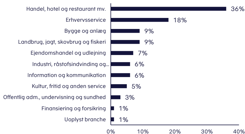
Figur 2. Ansøgende virksomheder fordelt på brancher i procent

Det er især virksomheder inden for brancherne handel, hotel og restaurant mv. samt erhvervsservice med henholdsvis 36 pct. og 18 pct., der tegner sig for hovedparten af ansøgningerne, jf. figur 2 . Virksomheder inden for brancherne handel, hotel og restaurant mv. har samlet fået godkendt lån for ca. 2,3 mia. kr.