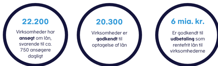
Figur 3. Status en uge inden ansøgningsfristen den 15. juni 2020

Fra Skattestyrelsen modtager en ansøgning, går der op til fem hverdage, før lånet udbetales til virksomheden. Inden lånet udbetales, foretages en kontrol af, om den pågældende virksomhed skylder penge til Skattestyrelsen eller har øvrig gæld til det offentlige. Denne gæld vil blive dækket, før lånet udbetales til virksomheden. Skattestyrelsen har indtil videre nedbragt virksomhedernes gæld under inddrivelse med 800 mio. kr. Herudover er en andel af lånene anvendt til at dække virksomhedernes øvrige krav på Skattekontoen, hvis de ikke er betalt.