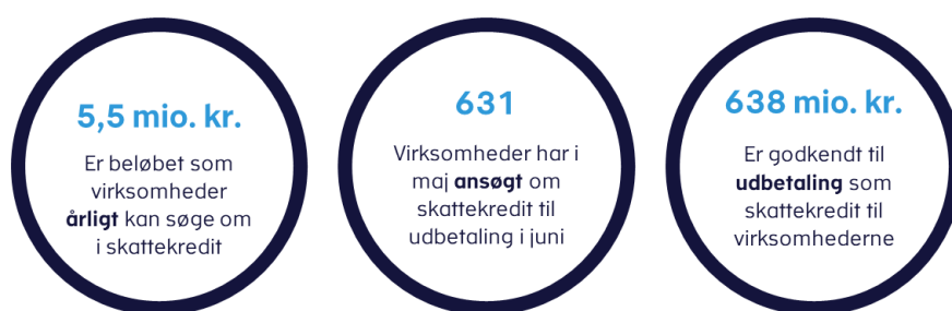
Figur 2. Status pr. 1/8 efter fremrykket udbetaling af skatte kreditter

Når virksomhedernes oplysningsskemaer indsendes senere på året, vil Skattestyrelsen ydermere kontrollere og sammenholde de oplyste udgifter til forsknings- og udviklingstiltag med de oplysninger, som er fremgået af ansøgningerne, der blev indsendt i maj.