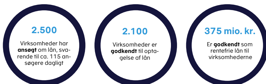
Figur 1. Status på låneordningen, 17. nov. – 8. dec. 2020

I perioden fra den 17. november 2020 til den 8. december 2020 har Skattestyrelsen modtaget og behandlet godt 2.500 ansøgninger. I alt har knap 2.100 virksomheder fået godkendt lån for ca. 375 mio. kr., jf. figur 1.