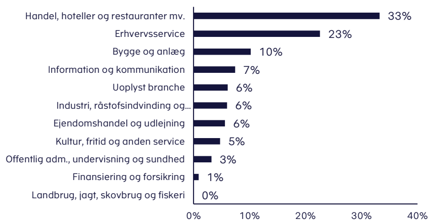
Figur 3. Ansøgende virksomheder fordelt på brancher i procent