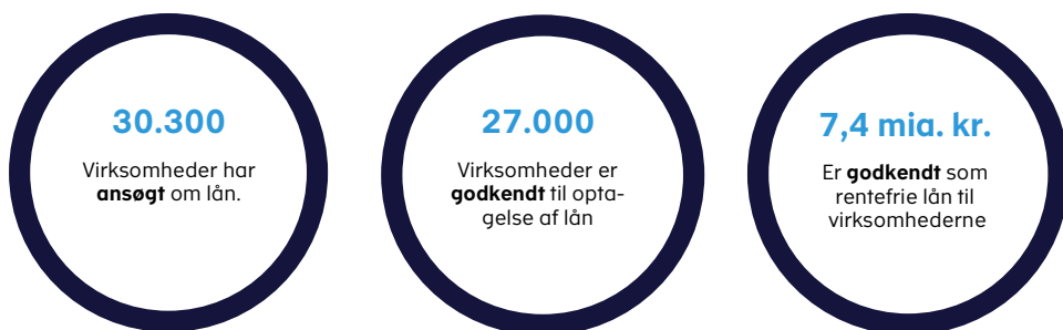
Figur 1. Status på låneordningen

Det er således ikke alle ansøgninger om rentefrie lån, der er blevet imødekommet. Skattestyrelsen har givet afslag til ca. 3.400 virksomheder, hvilket svarer til ca. 11 pct. af ansøgningerne. Virksomheder har eksempelvis fået afslag, hvis de ikke har indberettet enten moms eller lønsumsafgift i henholdsvis marts eller april 2020 til tiden, eller fordi de tidligere har søgt og allerede fået et lån.